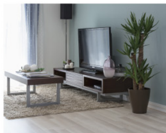
▲傷や汚れにも強い、ベルゴフロア(写真はイメージです)

暖かい家は家族の健康を守るために一番重要なこと。住む人の血圧を安定させ、結露やカビも防ぐので健康的な暮らしにつながります。採用した床材は、ベルギー製の高耐久フロアです。無垢材のようなぬくもりがあり、接着剤と釘を使わずにはめ込むだけ。溝が少ないので、つなぎ目に汚れがたまらず衛生的です。