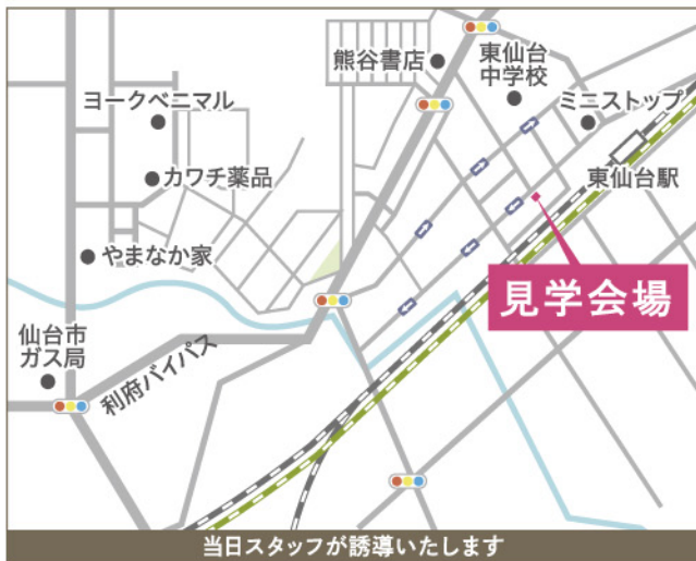
当日スタッフが誘導いたします