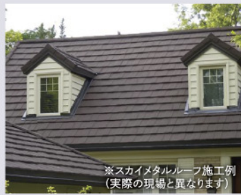
※スカイメタルーフ施工例 (実際の現場と異なります)