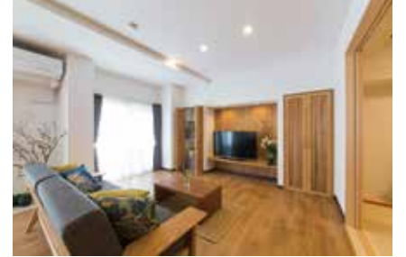
②サイズや用途に合わせたオリジナル造作