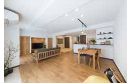
①LDKに和室も取り込んだ開放感のあるプラン