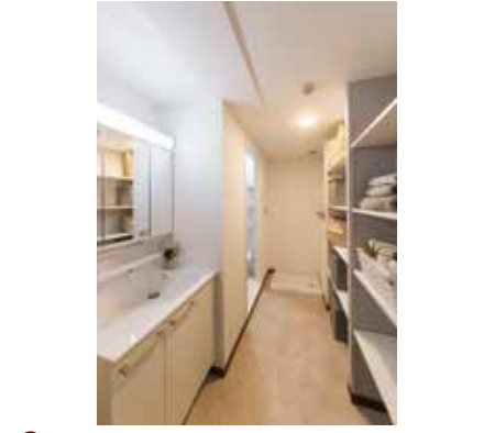
③あるべき物があるべき場所に納まる収納スペース ※写真は実際の内覧会場です。