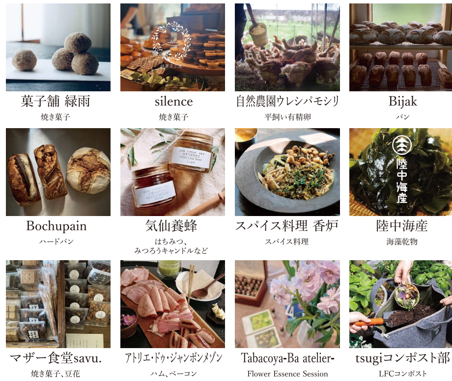
うんぬん vegan焼き菓子 菓子舗 緑雨 焼き菓子 silence 焼き菓子 自然農園ウレシバモシリ 平飼い有精卵 Bijak パン Bochupain ハードパン 気仙養蜂 はちみつ、みつろろキャンデルなど スパイス料理 香炉 スパイス料理 陸中海産 海産物 マザー食堂savu. 焼き菓子、豆花 アリエド+ジャンボソメノ ハム、ベーコン Tabocoya-Ba atelier- Flower Essence Session tsugiコンポスト部 LFCコンポスト

「必要なものを必要なぶんだけ」食品ロス削減やパッケージごみの削減をテーマに、2019年にスタートしたマルシェです。量り売りで必要な量を購入していただくことでムダをなく、お客様に容器をご持参いただくことでゴミを出さないお買い物体験ができます。ぜひタッパーやお弁当箱など使い捨てではない容器をご持参の上、お越しください。