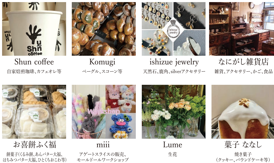
Shun coffee 自家焙煎珈琲、カフェオレ等 Komugi ベーグル、スコーン等 ishizue jewelry 天然石、鹿角、silverアクセサリー なにがし雑貨店 雑貨、アクセサリー、かご、食品 お喜餅ふく福 餅菓子(くるみ餅、あんバター大福、はちみつバター大福、ひとむくおこわ等) miii アゲートスライスの販売、モールドールワークショップ Lume 生花 菓子 ななし 焼き菓子(クッキー、パウンドケーキ等)

岩手の魅力をぎゅっと詰め込んだポップアップストアが期間限定で登場。素材にこだわったお菓子や加工品、職人の手仕事で光る雑貨など、岩手ならではの“良品”を取り揃えました。この機会に、岩手の風土と文化が生み出す魅力をぜひ体感してください。