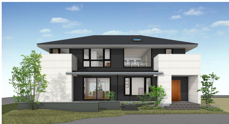
エコノハに登場する「プラッツ」シリーズ